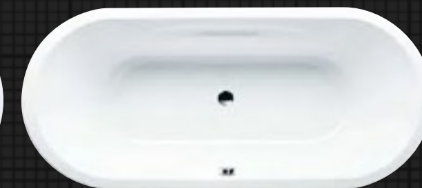
VAIO DUO OVAL